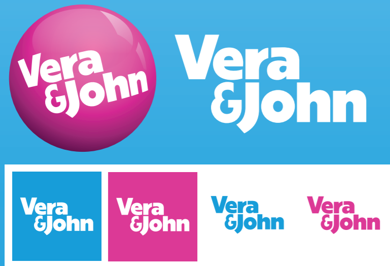
ロゴ / Logo