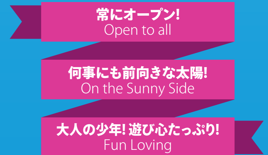
ベラジョン・トーン / Our tone of voice