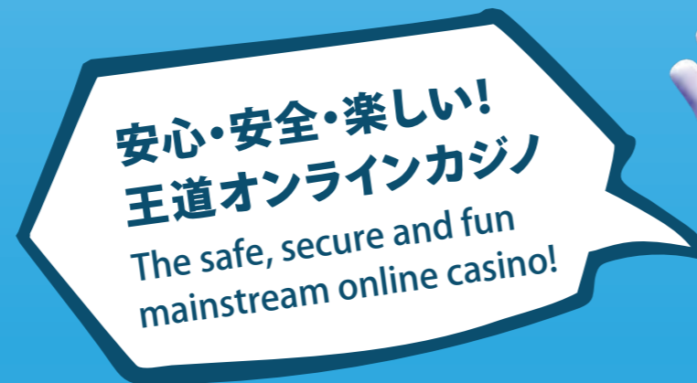
タグライン / Brand tagline