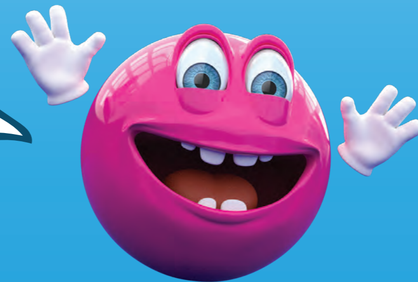
マスコット - ラッキー / Mascot - Lucky