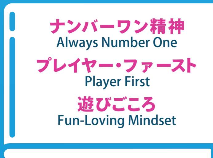
ベラジョンの理念 / Brand philosophy